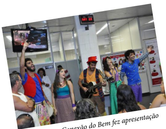
O Grupo Conexão do Bem fez apresentação

da unidade naquele sábado. A mobilização ocorreu em um período importante, véspera do Carnaval, pois, nesta época do ano, o comparecimento de doadores é reduzido em até 70%.