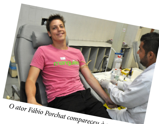
O ator Fábio Porchat compareceu à unidade